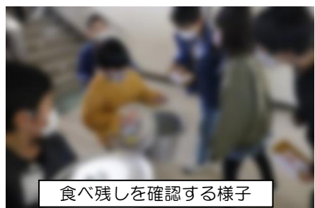
食べ残しを確認する様子