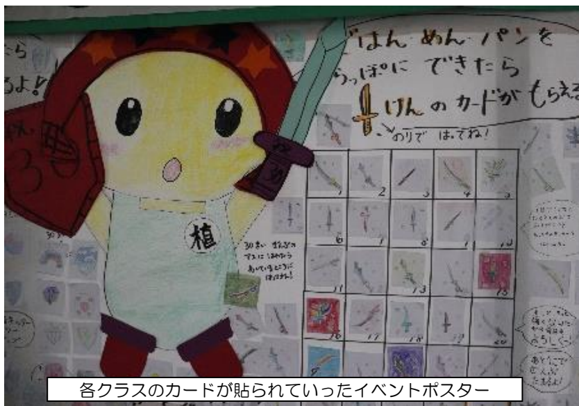
各クラスのカードが貼られていったイベントポスター