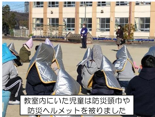
教室にいた児童は防災頭巾や防災ヘルメットを被りました

休み時間中のため廊下や運動場などにおり、指示を出す担任が近くにいない状況の子どもも多くいましたが、「緊急地震速報」の放送を聞くと、遊びをすぐにやめ、素早く避難することができました。今回は特に感染症対策を念頭に置いた訓練として行ったため、マスクの着用だけでなく、できるだけ密の状態にならないよう避難することを心がけました。