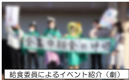
給食委員によるイベント紹介（劇）

給食をしっかりと食べ、元気に過ごすための取り組みとして、1月18日（月）～22日（金）に給食委員会が空っぽキャンペーン「全集中！給食の呼吸」イベントを行いました。給食を食べる邪魔をする悪者を倒すために「うえきったー」をみんなで強くするというイベントです。ごはんやおかずを完食したクラスが増えれば増えるほど、「うえきったー」が「剣」や「盾」を手に入れて強くなっていきました（各クラスが手に入れた「剣」や「盾」のカードはイベントポスターに貼っていき、全校での取り組みの様子が分かるようにしました）。各学級では完食できる日が増え、見事に悪者を倒すことができました。これからもバランスのよい食事を取り、元気で健康な体をつくってほしいと思います。