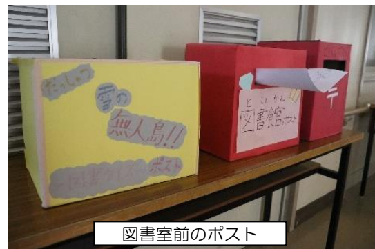
図書室前のポスト