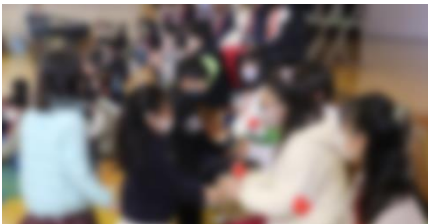
1年生は手作りメダル・花のプレゼントとかわいいダンスを踊りました

3月12日(金) 1, 2限に「6年生を送る会」が行われました。今年度は、全学年が一堂に体育館に集まるのではなく、各学年が順番に体育館に行き、それぞれの形で6年生にこれまでの感謝の気持ちを伝えました。