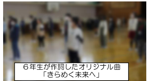
6年生が作詞したオリジナル曲「きらめく未来へ」

6年生からは、各学年の出し物に対するお礼の言葉が送られました。また、6年生から在校生や教職員へのプレゼントとして、サプライズ合唱が披露されました。6年生が自分たちで企画し、音楽の時間に自分たちで作った曲を歌いました。最上級生としてとても立派な姿を見せてくれました。