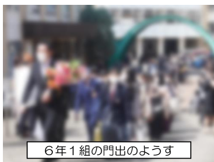
6年1組の門出のようす