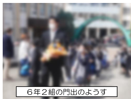
6年2組の門出のようす