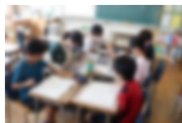
【交流について振り返る児童】

天白特別支援学校の児童との交流を通して知った、施設や児童の様子を振り返ることで、次回の交流に向けて、「特別支援学校の児童ができること」や「支援が必要なこと」などについて話し合いました。