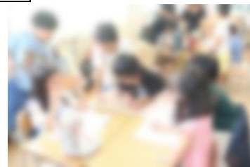
【たんけんのしおりを見合う様子】

今回の町たんけん（とつげき！お店ほうもん）を成功させるには、どのような準備をしたらよいかを考えました。同じお店の友達と協力しながら「たんけんのしおり」を作成することで、自分たちで主体的に取り組もうという意識を高めることができました。