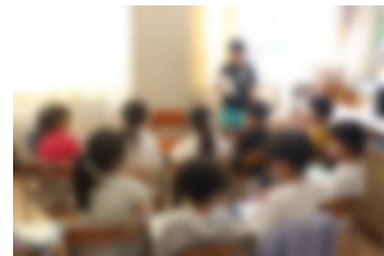
【司会の児童を中心に話し合う様子】

生き物のひみつを、「誰に」「どのように」発表するかというゴールを設定し、ゴールを達成するまでに「身に付けたい力」をグループで話し合い、自分の課題を考えました。