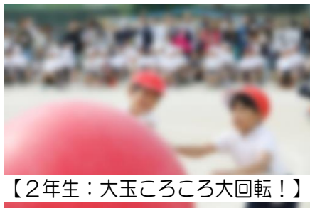
【2年生：大玉ころころ大回転！】