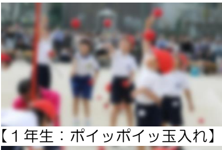
【1年生：ポイッポイッ玉入れ】