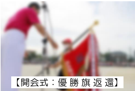
【開会式：優勝旗返還】