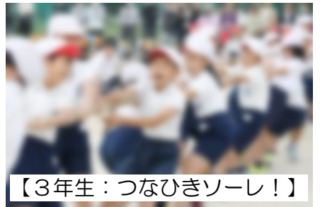
【3年生：つなひきソーレ！】