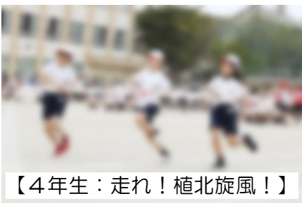
【4年生：走れ！植北旋風！】