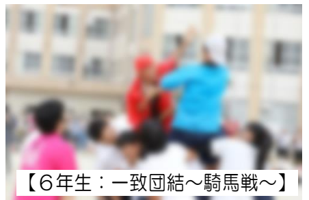
【6年生：一致団結～騎馬戦～】