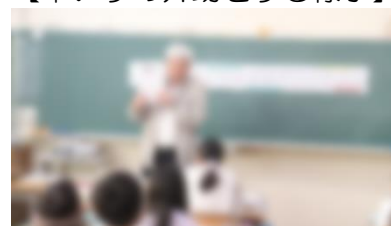
【点字についての話を聞く様子】