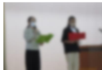
【あいさつをする委員長】

10月23日(月)に後期委員会の認証式を行い、各委員会の委員長に認証状が手渡されました。また、27日(金)には、児童集会を行い、委員長から着任のあいさつと委員会からのお願いのお話がありました。児童会会長からは、「植田北小学校をより良い学校にするために、一人になっている子がいたら、進んで声をかけましょう」というお話がありました。