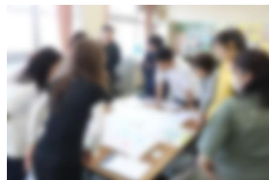
【「学びのコンパス」について話し合う様子】

今回は、その中で「重視したい学びの姿」として示された「自分に合ったペースや方法で学ぶ」「多様な人と学び合う」「夢中で探究する」の3つの姿について、教職員で話し合い、「タブレットの有効活用」「積極的な子ども同士での学び合い」「習熟度や興味・関心により、子どもが学習内容や進度を自ら選択できる工夫」など、様々な意見が出されました。今後も、教職員で対話を重ねながら、「子ども中心の学び」を大切にできる植田北小学校を目指していきます。