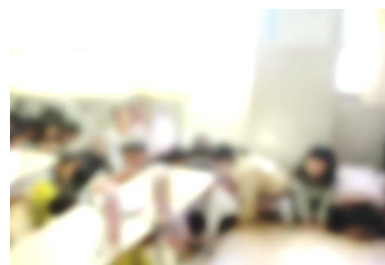
【静かに身を潜める児童の様子】

10月30日（月）に、不審者が校内に侵入したことを想定した「防犯訓練」を行いました。不審者役の天白警察署の警察官が校内を歩き回ると、子どもたちは、教室の鍵を閉め、不審者に見つからないように静かに身を潜めました。教職員が不審者を取り押さえた後、体育館に移動して警察の方から防犯に関する「つみきおに」の合言葉のお話を聞きました。