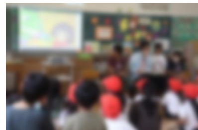
【図書委員による「読み聞かせ会」の様子】

今回は、図書委員会の子もたちが、休み時間におすすめの本の読み聞かせを行う「読み聞かせ会」に取り組みました。休み時間になると、たくさんの子もたちが図書室に集まり、本の読み聞かせを楽しむ姿が見られました。