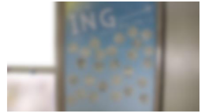
【作成した「INGオリジナルポスター」】